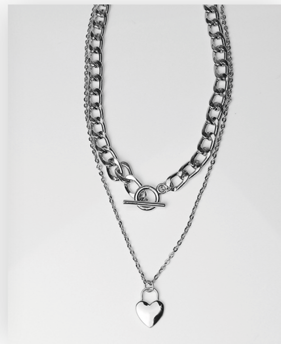
Kette Dona, silver Art. Nr. 09358