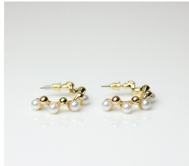
Ohrschmuck Berenice, gold/weiß Art. Nr. 09382