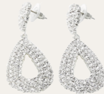
Ohrschmuck Crystal Drop, silber/crystal Art. Nr. 09129