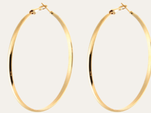
Creolen Valea, gold Art. Nr. 06938