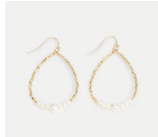
Ohrschmuck Ayana, gold/pearl Art. Nr. 09373