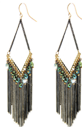
Ohrhänger Susn gold/schwarz Art. Nr. 05018