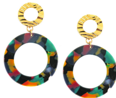
Ohrschmuck Elga, gold/multi Art. Nr. 08676