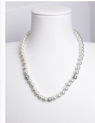
Kette Perlen, weiß-crystal Art. Nr. 08551