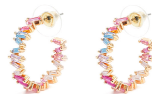
Ohrschmuck Chinara, gold/multi Art. Nr.09577