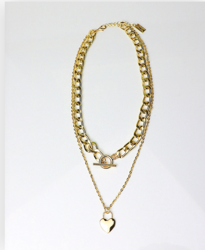
Kette Dona, gold Art. Nr. 09357