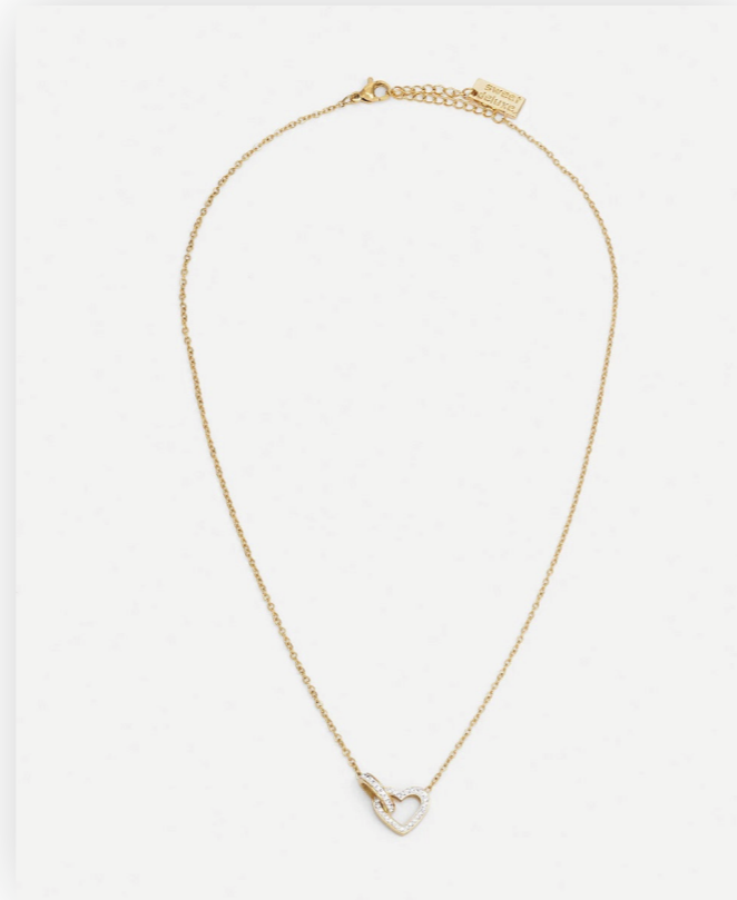
Kette Freda, gold/crystal Art. Nr. 09437