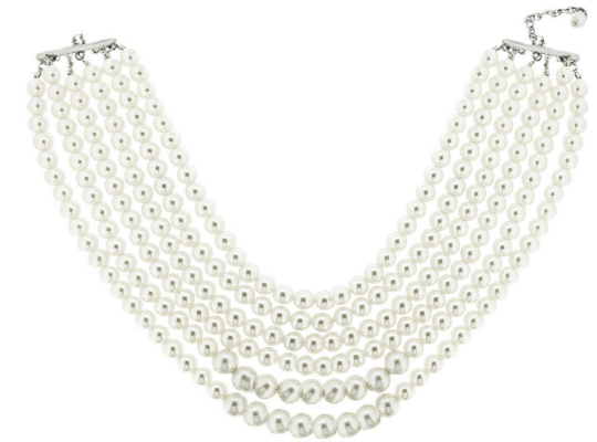
Kette Jaime, silber/Perlen Art. Nr. 07796