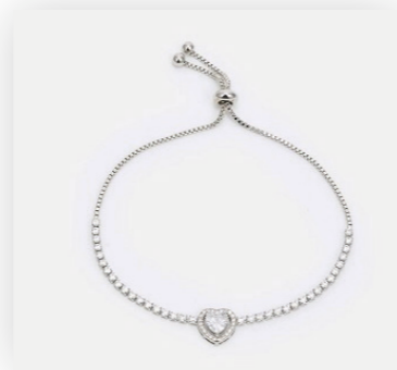
Armband Camellia, silver/crystal Art. Nr. 09570