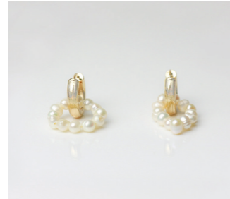
Ohrschmuck Charlize, gold/pearl Art. Nr. 09377