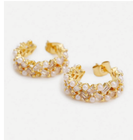
Ohrschmuck Cairtriona, gold/pearl Art. Nr. 09608