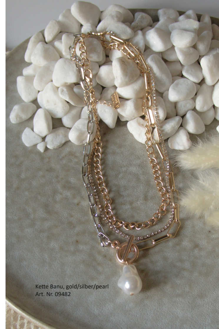
Kette Banu, gold/silber/pearl Art. Nr. 09482