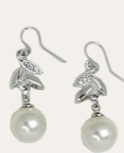
Ohrschmuck silber/pearl Art.Nr. 09261