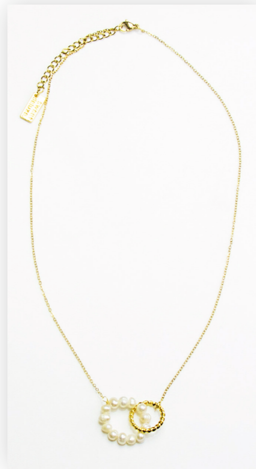
Kette Darlin, gold/pearl Edelstahl/Süßwasserperlen Art. Nr. 09609