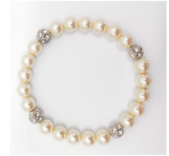
Armband, pearl /crystal Art. Nr. 09624