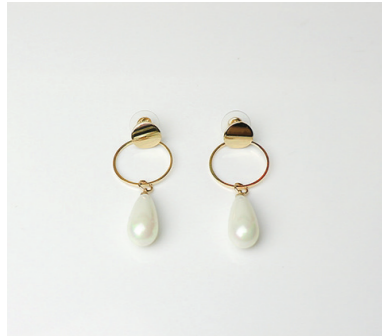
Ohrschmuck Dietje, gold/pearl Art. Nr. 09374