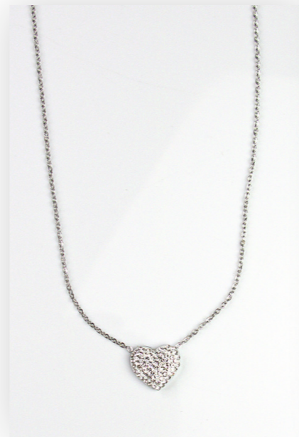
Kette Diamond Heart, silver/crystal Art. Nr. 09516