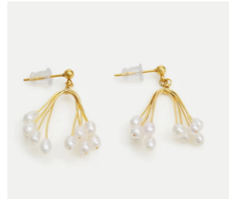
Ohrschmuck Annesca, gold/pearl Art. Nr. 09474