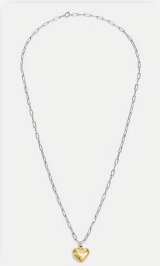
Kette Bahareh, silber/gold Edelstahl Art. Nr. 09509