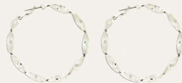
Ohrschmuck Florina, silber Art. Nr.08584