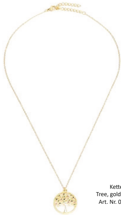
Kette Tree, gold/multi Art. Nr. 09465