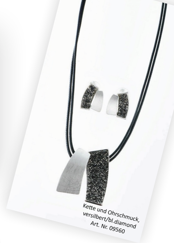
Kette und Ohrschmuck, versilbert/bl. diamond Art. Nr. 09560