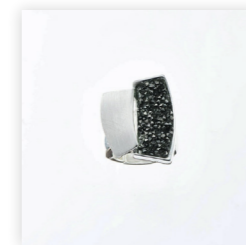
Stretchring, versilbert/bl. diamond Art. Nr. 09561