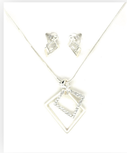
Kette u. Ohrschmuck, silber/ mattsilber/crystal Art. Nr. 09240