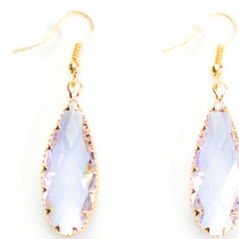
Ohrschmuck Corina, gold/li.purple Art. Nr. 09572