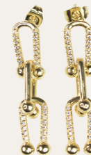
Ohrschmuck Anja, gold/crystal Art. Nr. 09462