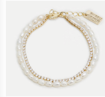
Armband Arven, gold/pearl Art. Nr. 09569