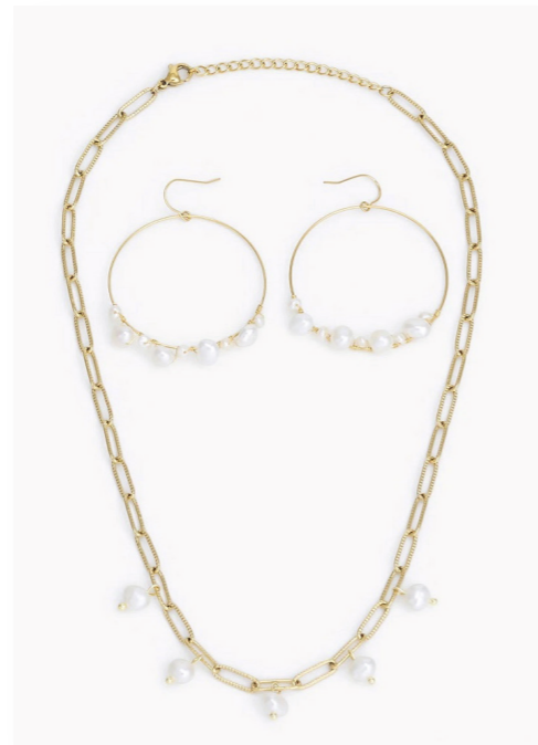
Kette und Ohrschmuck Set, gold/pearl Edelstahl Art. Nr. 09470