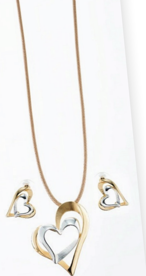
Kette und Ohrstecker, bi-color Art. Nr. 09541

UNSER SCHMUCK-SET BESTEHEND AUS KETTE UND OHRSCHMUCK, DAS SICH ZEIGEN WILL.