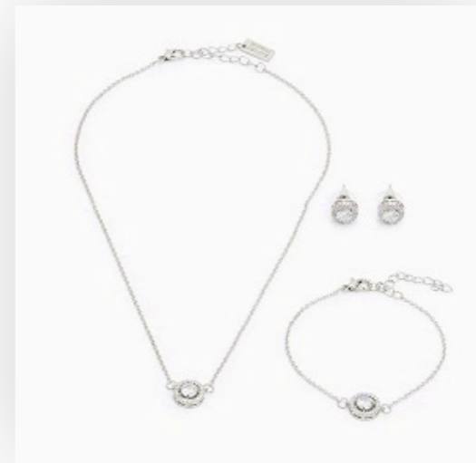
Kette, Armband, Ohr-Set Cora, silber/transparent Art. Nr. 09584