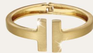
Armspange Tandil, mattgold Art. Nr. 05089