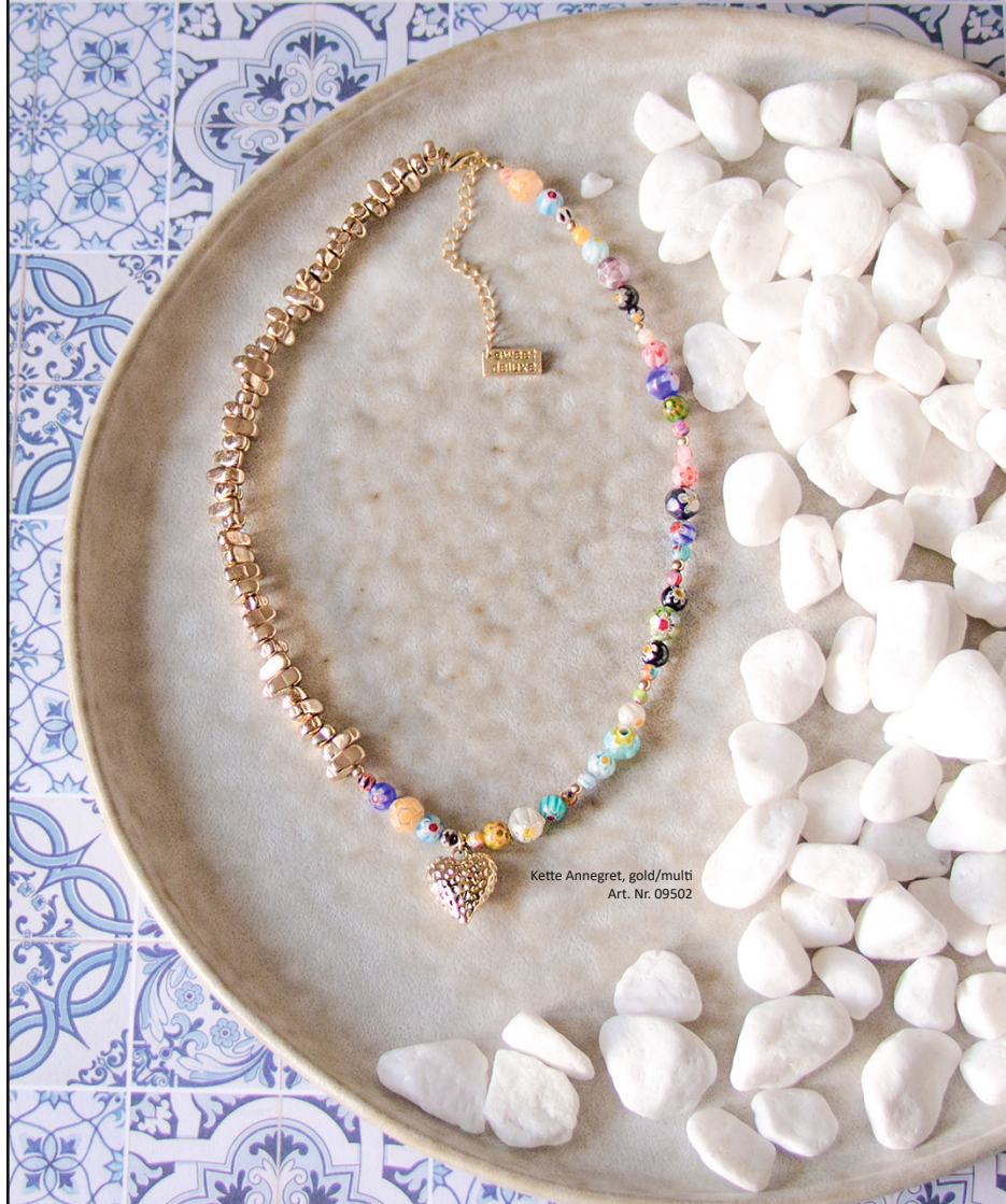
Kette Annegret, gold/multi Art. Nr. 09502

Wir wechseln regulär unsere Schmuckteile- öffters reinschauen lohnt sich.