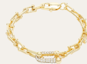
Armband Aliy, gold/crystal Art. Nr. 09452