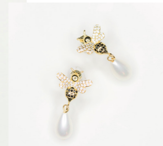
Ohrschnuck Bee and Pearl, gold/pearl/crystal Art. Nr. 09626