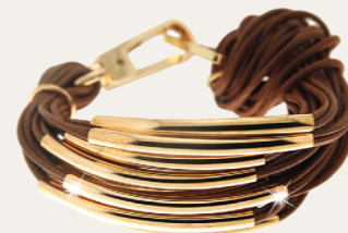
Armband Ella, gold/braun Art. Nr. 04040