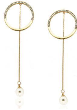
Ohrschmuck Fjella, gold/crystal/Perle Art. Nr. 08609