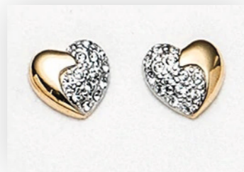
Ohrschmuck Herz, gold/crystal(echt vergoldet) Art. Nr. 09553

STARTEN SIE DOCH MIT EINEM DEZENTEN, NUR LEICHT DURCHSICHTIGEN TOP UND DAZU MIT EINER UNSERER KETTEN, SPIELERISCH ALS BLICKFANG.