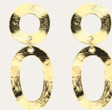
Ohrschmuck Fuki, gold Art. Nr. 08588