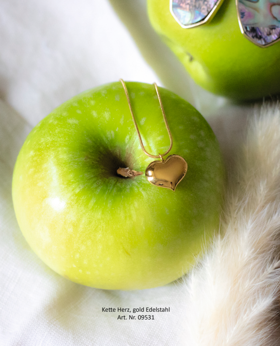
Kette Herz, gold Edelstahl Art. Nr. 09531