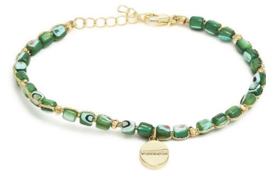
Armband Christien, gold/grün Halbedelsteine Art. Nr. 09522