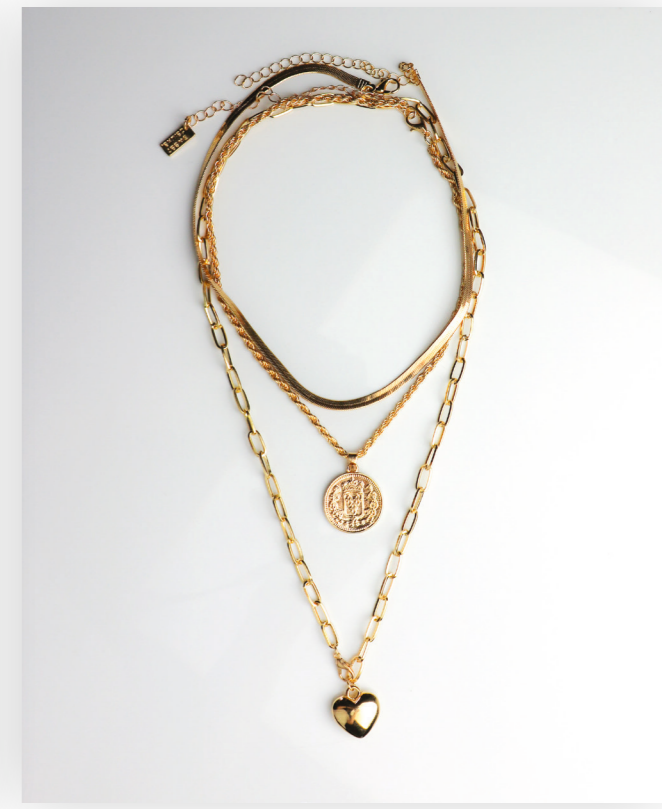
Kette Kette Benedicta, gold Art. Nr. 09481